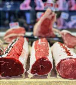
9008 Châteaubriand 95.00 €/kg

"Dites nous vos souhaits culinaires, nos bouchers prépareront vos morceaux adéquats."