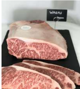
9100 Wagyu Japon 290.00 €/kg