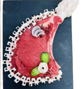
Côte à l'os "au four"